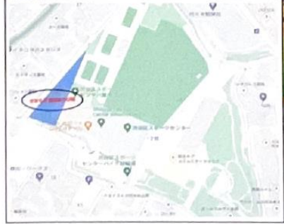
活動場所：渋谷区スポーツセンター「子どもひろば」

自分の責任自由遊ぶ どこでもあそぼう日曜日 ドロンゴトカンがのり たまにはしはいるのり たまにはケガをしちゃう あそびのちからは むげんだい!!